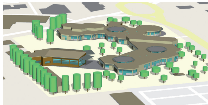
Bâtiments modélisés par ENERGIO